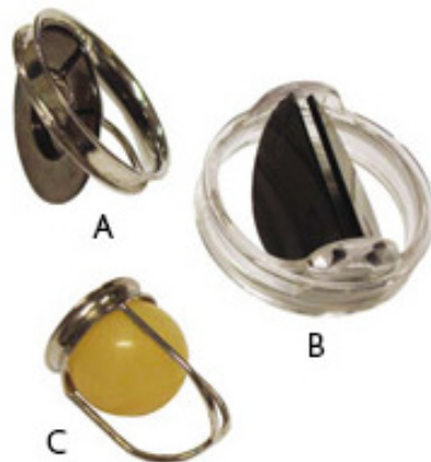
Figuur 4: mechanische kunstkleppen, in werkelijkheid veel kleiner (bron: Hartwijzer) A. Model met 1 klepblad. B. Model met 2 klepbladen. C. Model 'bal-in-kooi'

Om te ondersteunen bij het maken van een keuze is de website hartklep.keuze.nl opgezet. Hier vindt u praktische informatie over hartklepaandoeningen en een keuzehulp. Een keuzehulp geeft informatie over de voor- en nadelen van iedere behandeling en inzicht in uw persoonlijke voorkeuren daarbij. Om de keuzehulp te doorlopen moet u eerst inloggen.