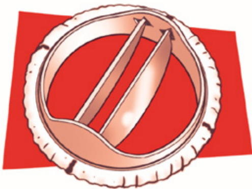
Figuur 3: kunstklep

De mechanische klep of kunstklep is gemaakt van kunststof materiaal. Dit heeft als voordeel dat de klep levenslang meegaat. Een nadeel is dat de klep een tikkend geluid maakt. Ook moet u levenslang antistollingsmiddelen slikken.